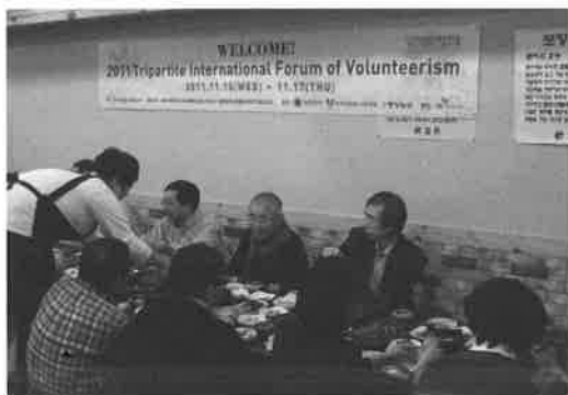
フォーラム前日に開かれた歓迎晩餐。3国の関係者が懇親を深めた(2011年11月15日、ソウル)

我々はフォーラムの当日にどれくらいの人たちに来てもらえるか、そして日本と中国からの